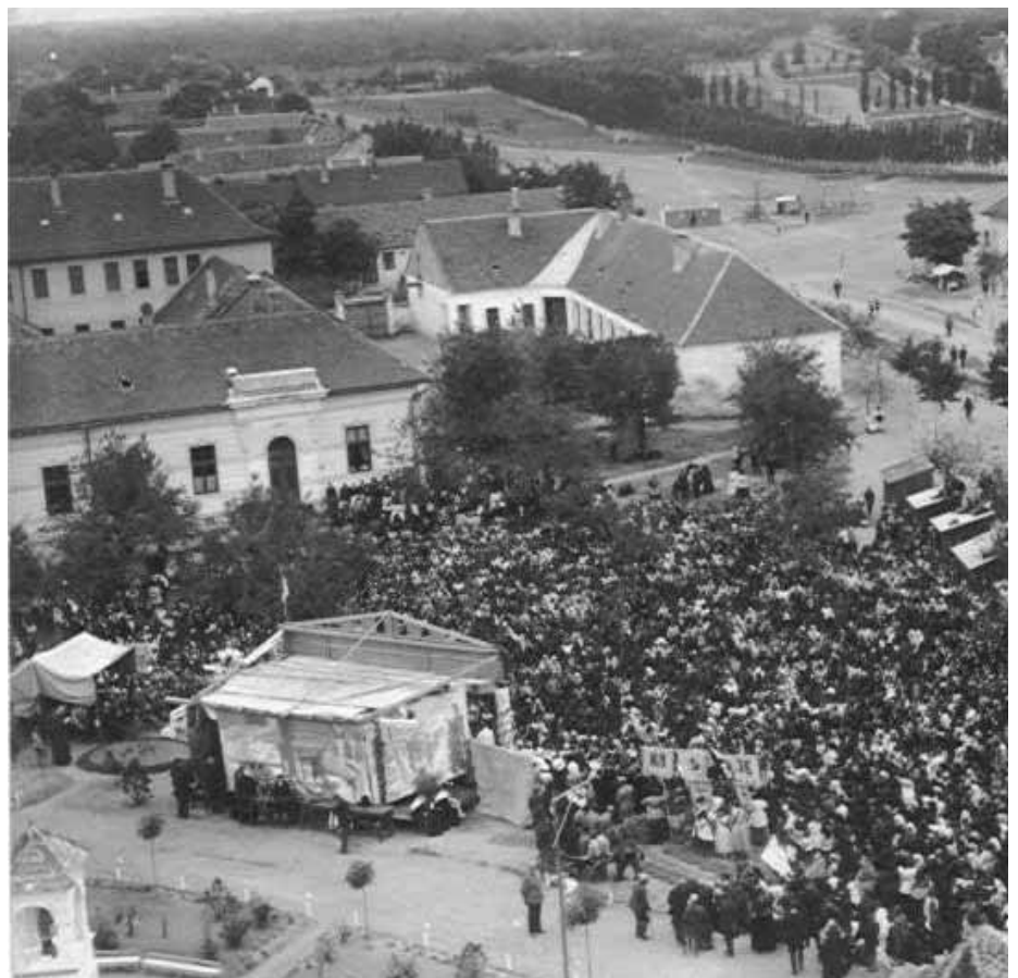
A zárda, a leány- és a fiúiskola épülete